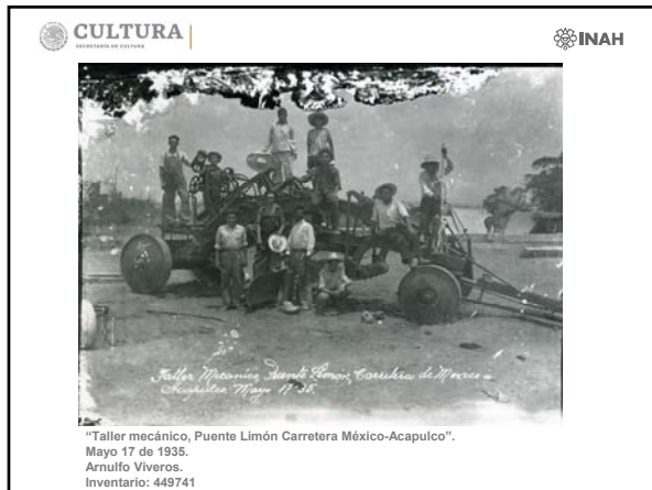
"Taller mecánico, Puente Limón Carretera México-Acapulco". Mayo 17 de 1935. Arnulfo Viveros. Inventario: 449741