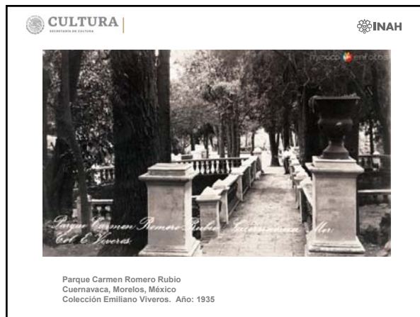
Parque Carmen Romero Rubio Cuernavaca, Morelos, México Año: 1935