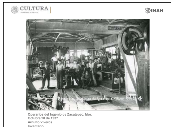
Operarios del Ingenio de Zacatepec, Mor. Octubre 20 de 1937 Arnulfo Viveros. Inventario