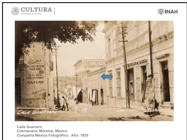
Calle Guerrero Cuernavaca, Morelos, México Compañía México Fotográfico. Año: 1935