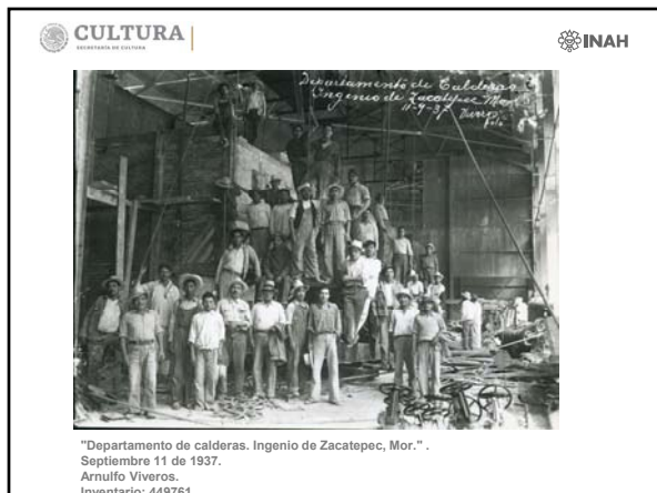
"Departamento de calderas, Ingenio de Zacatepec, Mor.". Septiembre 11 de 1937. Arnulfo Viveros. Inventario: 449761

Rebautizado como el Ingenio Emiliano Zapata, su operación quedó en manos de una cooperativa de obreros y campesinos.