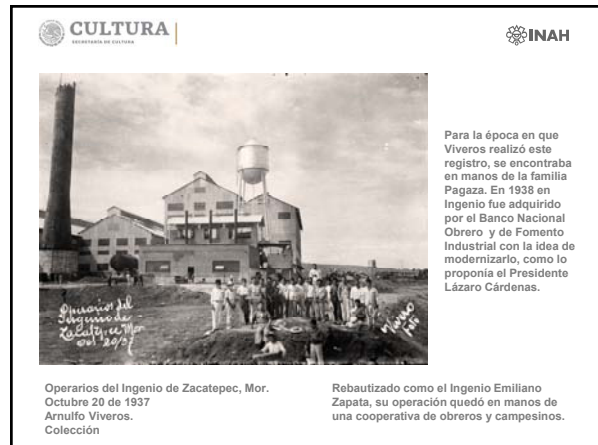
Operarios del Ingenio de Zacatepec, Mor. Octubre 20 de 1937