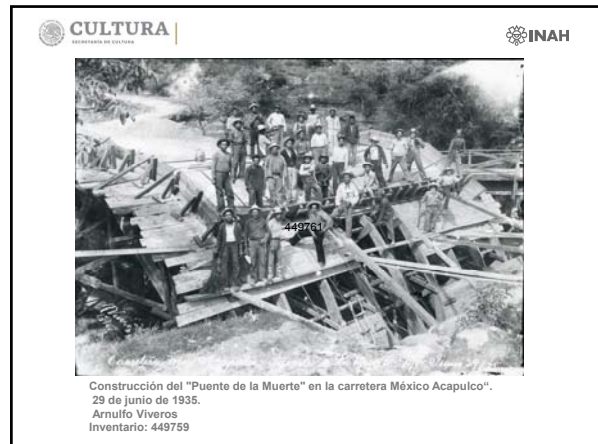
Construcción del "Puente de la Muerte" en la carretera México Acapulco". 29 de junio de 1935. Arnulfo Viveros Inventario: 449759