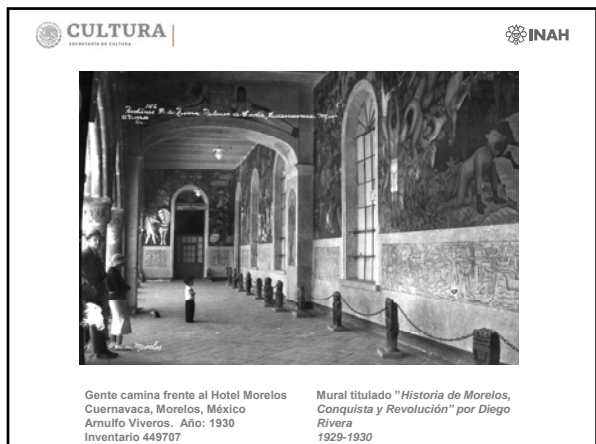
Gente camina frente al Hotel Morelos Cuernavaca, Morelos, México Año: 1930 Inventario 449707 Mural titulado "Historia de Morelos, Conquista y Revolución" por Diego Rivera 1929-1930