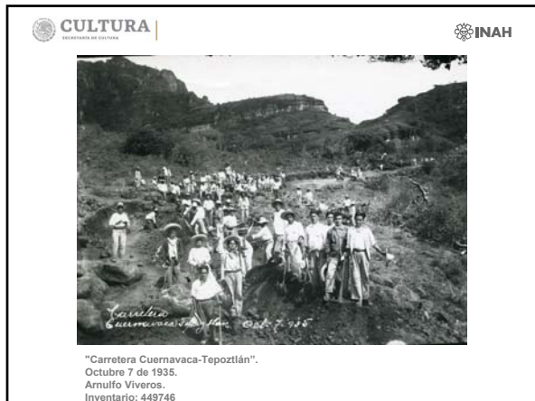
"Carretera Cuernavaca-Tepoztlán". Octubre 7 de 1935. Arnulfo Viveros. Inventario: 449746