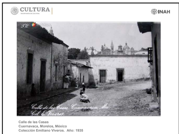
Calle de las Casas Cuernavaca, Morelos, México Colección Emiliano Viveros. Año: 1935